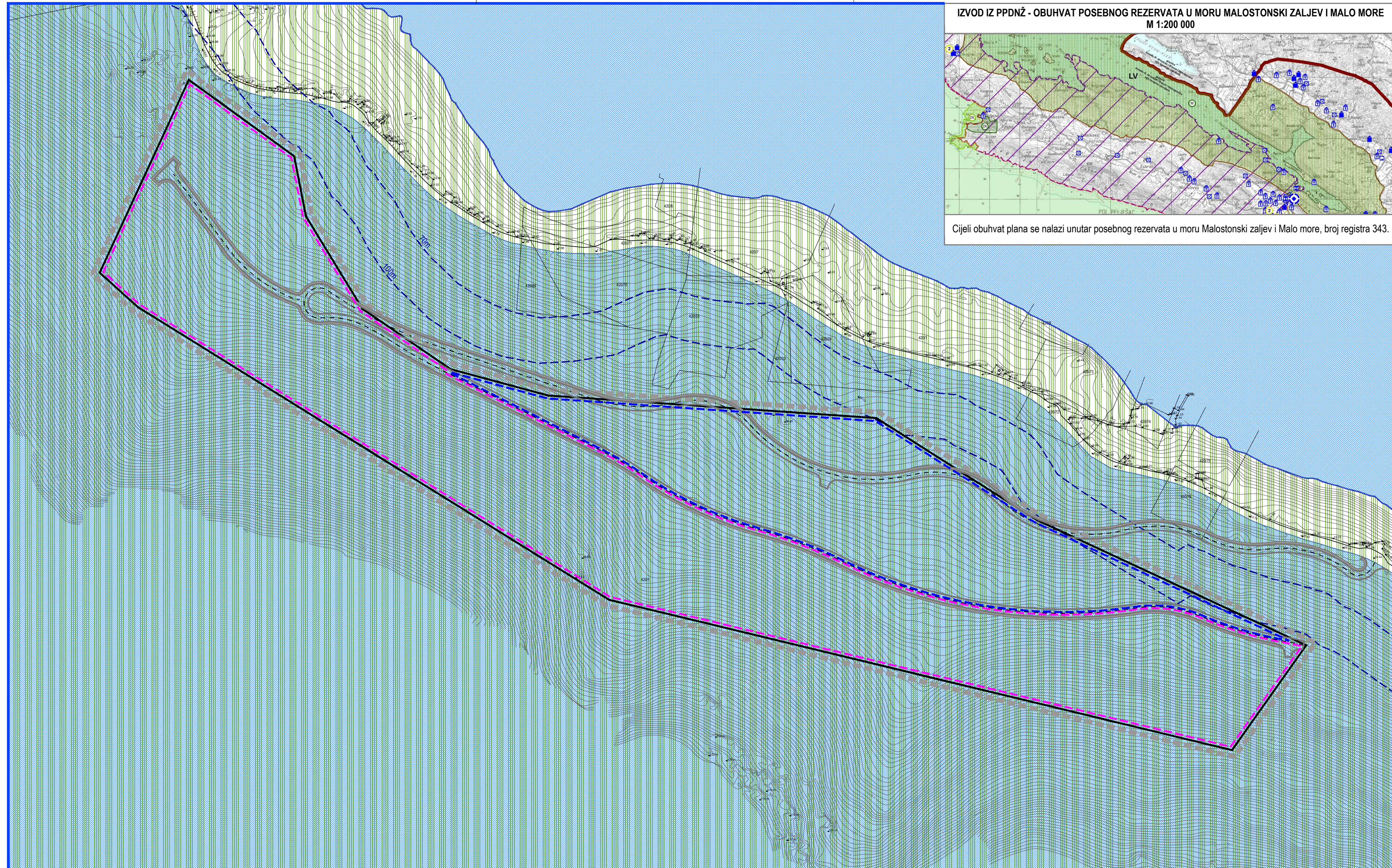
IZVOD IZ PPDNŽ - OBUHVAT POSEBNOG REZERVATA U MORU MALOSTONSKI ZALJEV I MALO MORE M 1:200 000